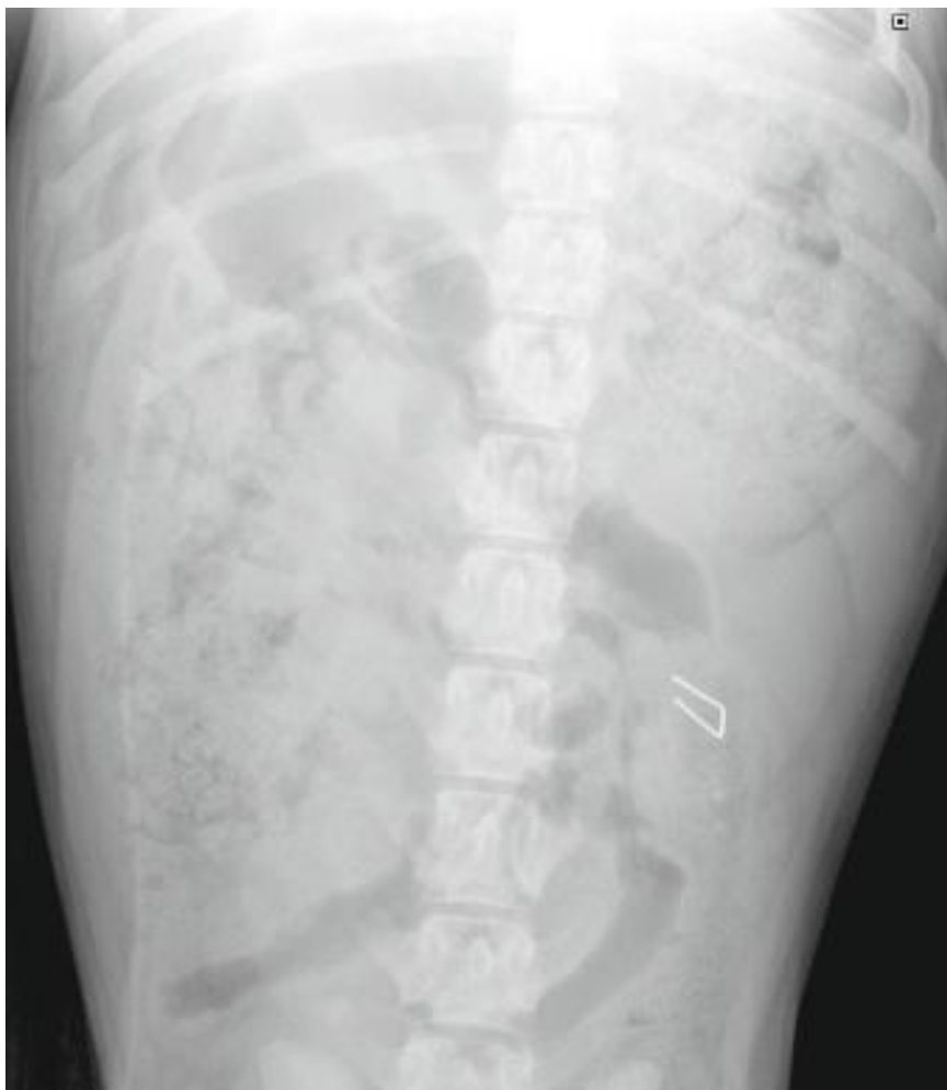
Figuur 2. Laterale röntgenopname van het abdomen van Boris.

Maar hoe liep het nu af met Boris? Op de gemaakte röntgenfoto trekt het nietje de meeste aandacht. Het scherpe voorwerp